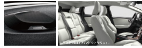
プレミアムサウンド・オーディオシステム harman/kardon 人間工学的にデザインされた手触りの良いレザーに包まれたシート